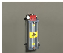
» Dispositivo de corte en seco