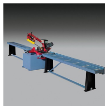
» Camino de rodillos