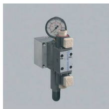
» Regulador presión mordaza