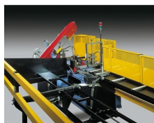
» Cargador C 6000 D 120