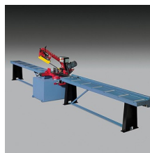
» Camino de rodillos