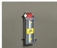
» Dispositivo de corte en seco