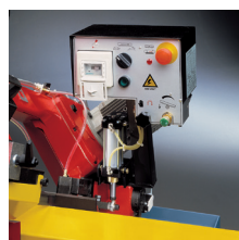
» Bajada controlada