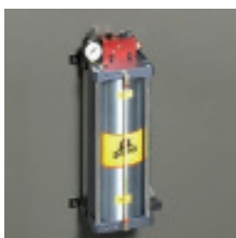
» Dispositivo de corte en seco