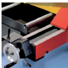
» Mordaza neumática